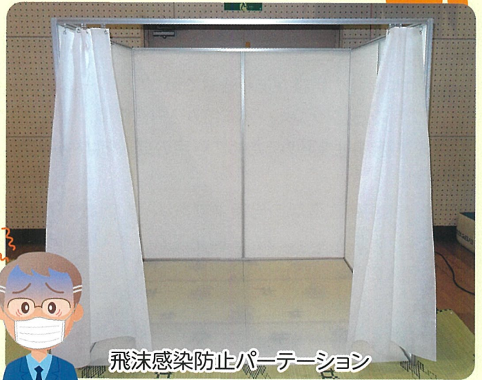
飛沫感染防止パーテーション

コロナ禍以降、当社は現場の声を聴いて感染拡大防止のためのプラスチック製ダンボールにアルミフレームを用いた飛沫感染防止パーテーションの開発に取り組み、1.8m四方のプラスチック段ボールに抗ウイルス・抗菌・消臭・VOC吸着除去の特殊機能・効果を持つ消石灰由来のシックイ塗料（アレスシックイ・関西ペイント製）を塗布することにより、感染症の拡大防止に大きな力を発揮するパーテーションを開発致しました。